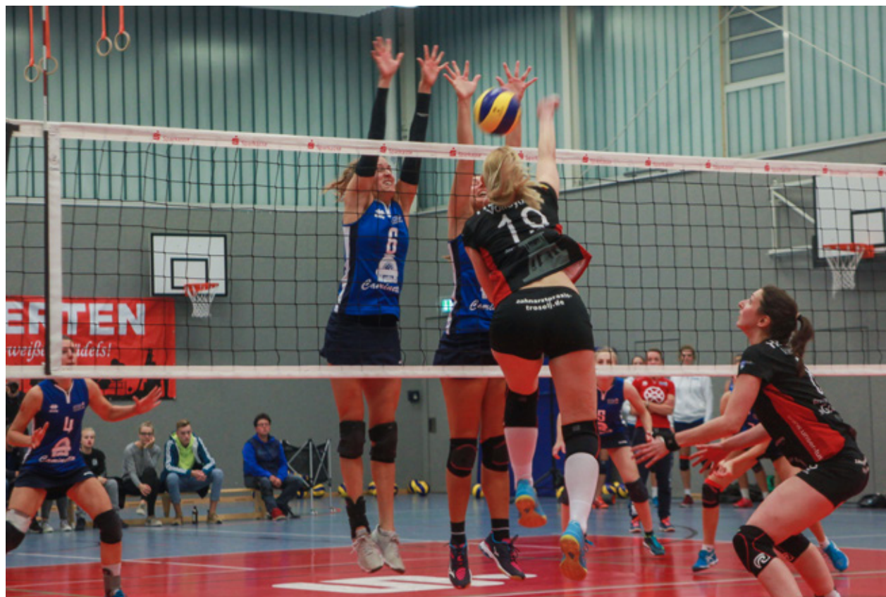
Unüberwindbarer Block für die Relegationsgegner aus Spelle.

In der vergangenen Spielzeit gelang uns der bisher größte Erfolg unserer Geschichte: Der Aufstieg in die dritthöchste Spielklasse.